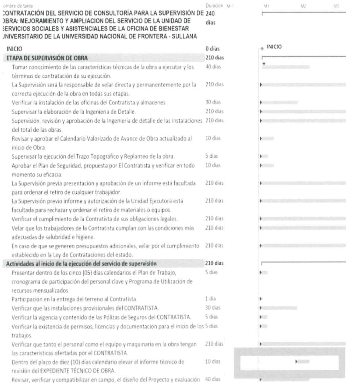
Esquema 10: programación Gantt genera

Como se aprecia en la imagen, esta tarea es a los 10 días calendario de iniciado el servicio, sin embargo aparece en el mes 2.