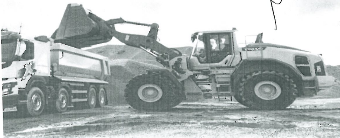
La cuchara global