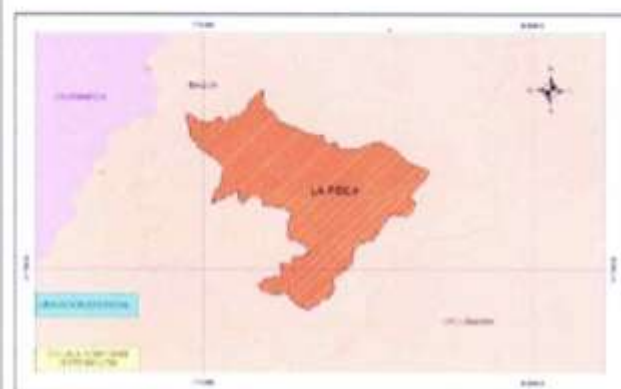
MAPA DE UBICACIÓN DISTRITAL