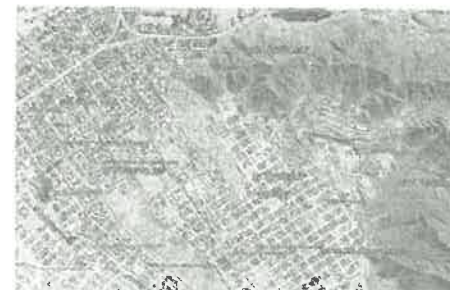
Figura N°1 Imagen satelital de Localización de Vista Alegre