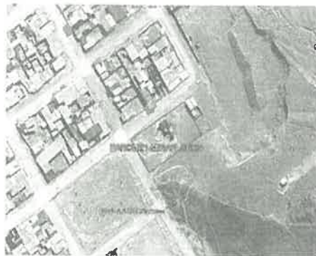
Figura N°2 Imagen satelital de la zona del Proyecto