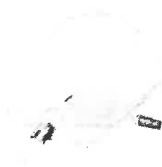
Fig. 1 (No incluye diseño)