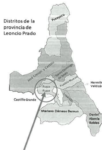
AMBITO DE INFLUENCIA DISTRITO RUPA RUPA - CIUDAD DE TINGO MARIA