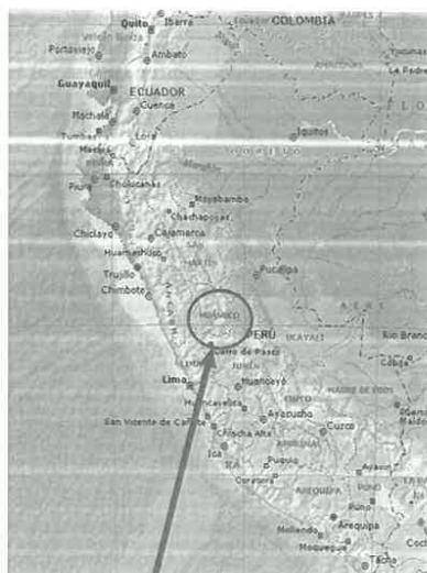
LOCALIZACIÓN: NACIONAL - REGIONAL