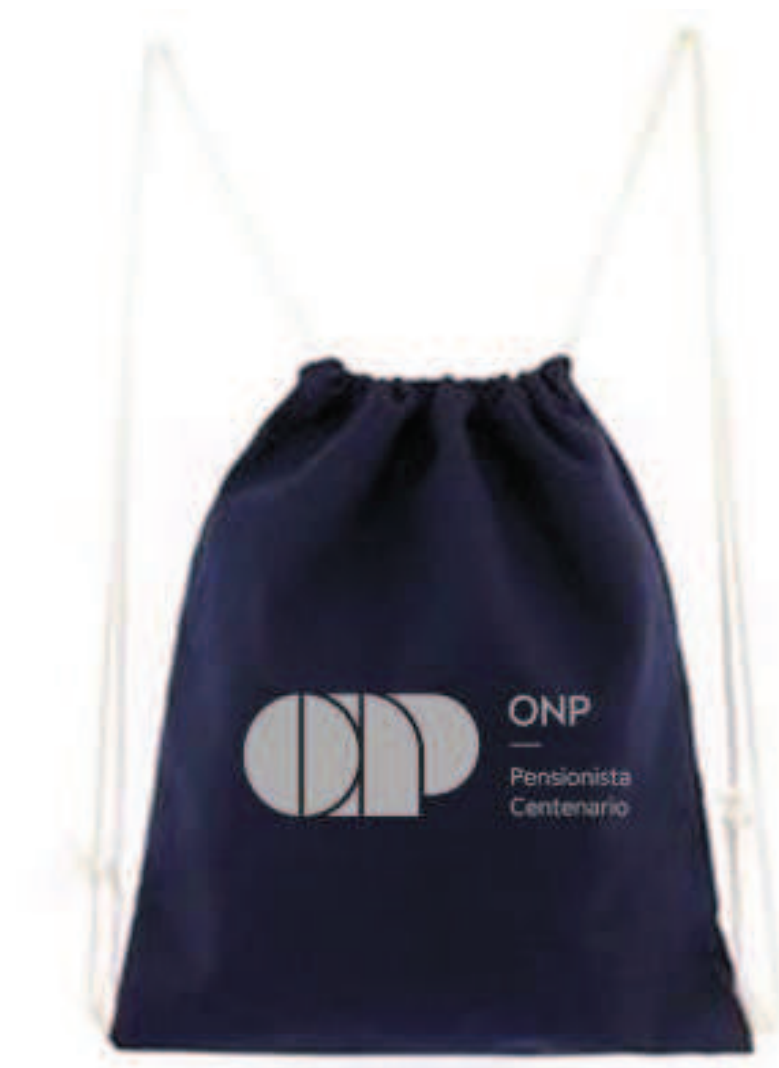
Imagen referencial N° 07 - bolsa de tela