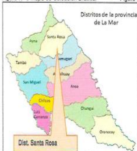
Figura N° 3 Mapa de Ubicación Distrital