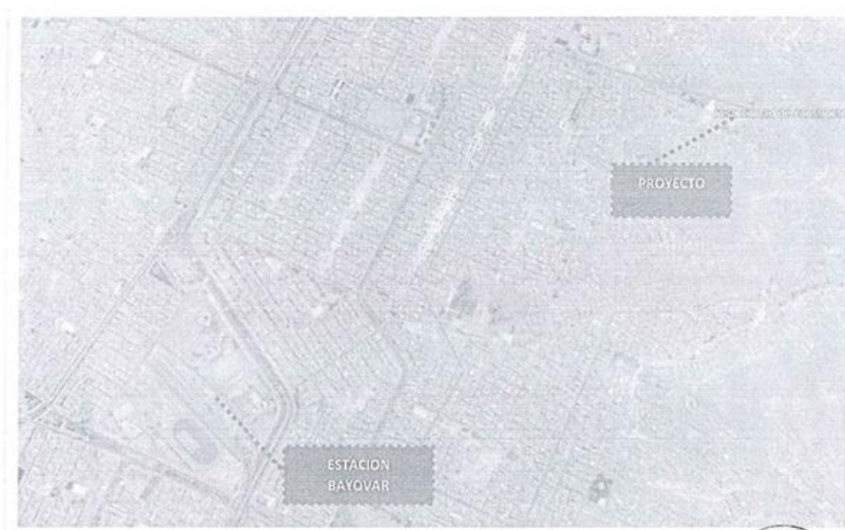
Imagen 2: Vías de acceso

El acceso por donde se accede a la A.H. AMPLIACION CIUDAD DE LOS CONSTRUCTORES tomando como referencia la última estación del tren "bayovar" es de 15min, tomando la ruta por la av. Central, ir a la derecha con dirección a la AV. Circunvalación.