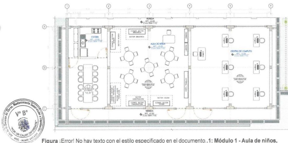
Figura 1: Módulo 1 - Aula de niños, centro de cómputo y cocina

Del mismo modo, los ambientes en mención serán implementados con el equipamiento adecuado, llámense escritorios, sillas, estantes, computadoras, accesorios de cocina, etc.