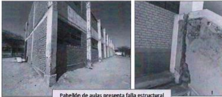
Pabellón de aulas presenta falla estructural