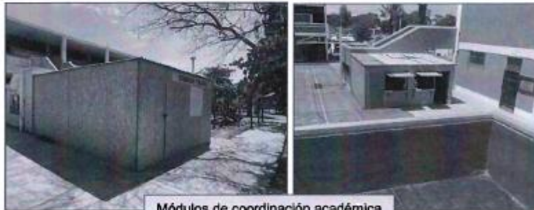
Módulos de coordinación académica