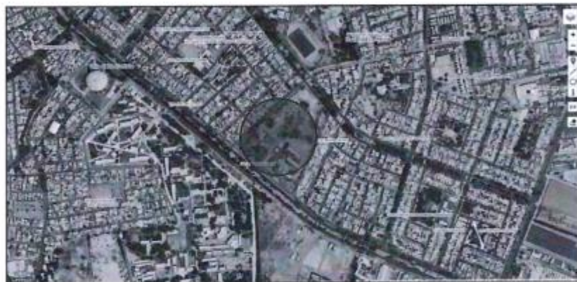
Ubicación de la institución educativa nivel secundaria José Toribio Polo – distrito de Ica, provincia de Ica, departamento de Ica.

La institución educativa nivel secundaria José Toribio Polo, se encuentra ubicado en el distrito de Ica, provincia de Ica, departamento de Ica, cuyo terreno se encuentra inscrito en los registros públicos con uso a favor del Ministerio de Educación en la partida N°02002434, con un área de 52,404.62 m2.