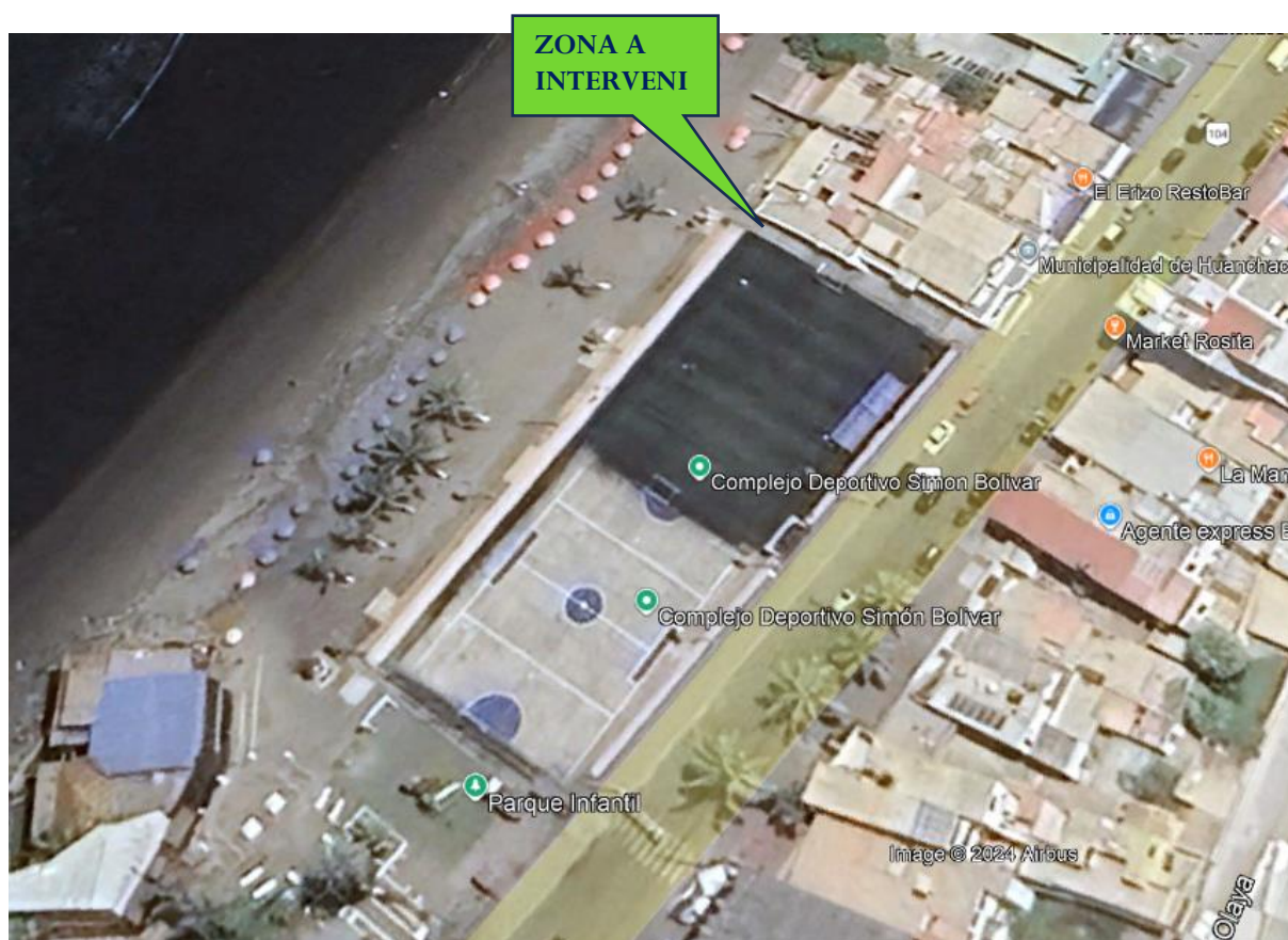
Zona de mejoramiento