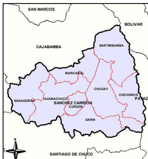
Imagen N° 04: Ubicación del Caserío La Conga en el Distrito de Huamachuco