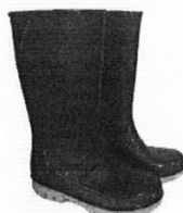
Botas de Jebe