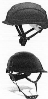
Casco de Seguridad