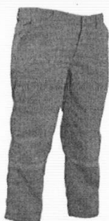
Uniforme de Mantenimiento