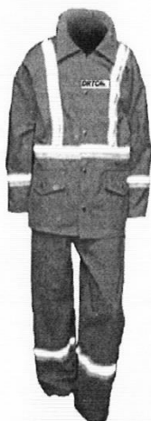
Uniforme de Mantenimiento