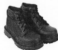
Zapatos de Seguridad con Puntera de Acero