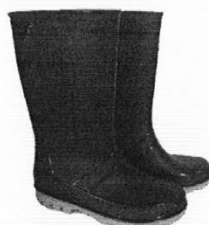
Botas de Jebe