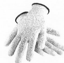
Guantes de Seguridad de Obra