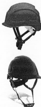
Casco de Seguridad