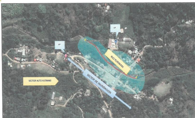
CROQUIS DEL TRAMO A INTERVENIR