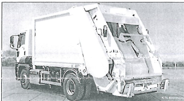
Imagen referencial del vehículo compactador de residuos sólidos de capacidad de 15 m 3

Los Baños del Inca, 02 de agosto del 2024.