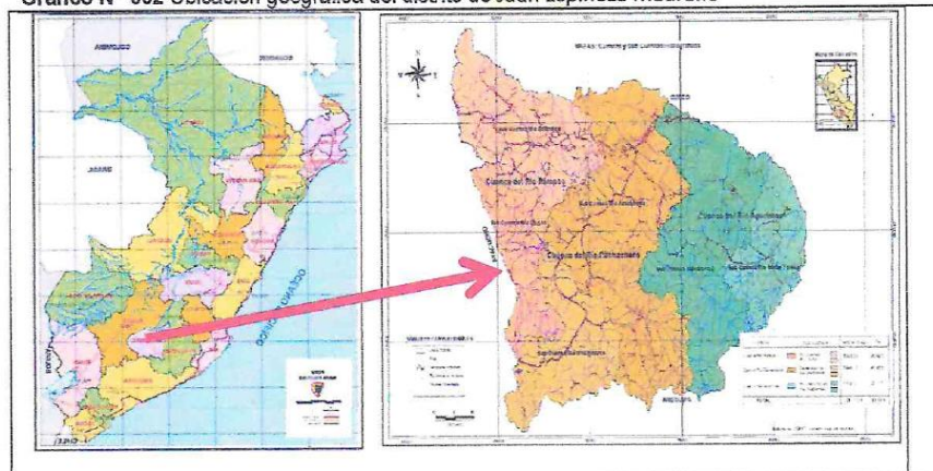
Gráfico N° 002 Ubicación geográfica del distrito de Juan Espinoza Medrano