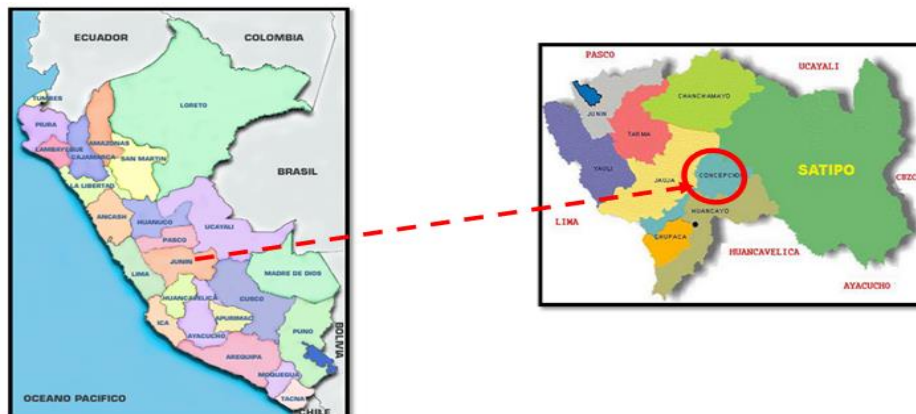
Figura N° 1 Plano macro - localización, nivel nacional y departamental