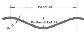
Figura 1. Dimensiones de la corruga 68.00 mm x 13.00 mm

En Tabla 4 se muestran los requerimientos dimensionales referentes a la corruga.