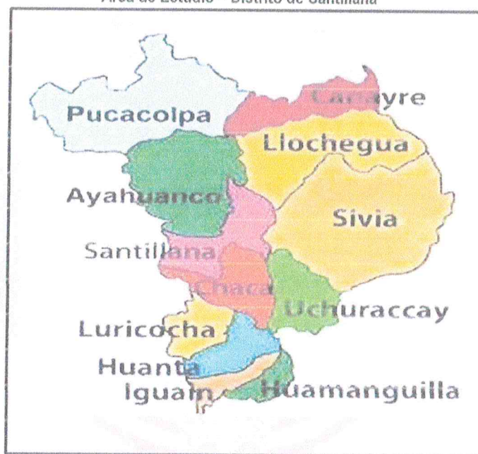
Área de Estudio – Distrito de Santillana

El proyecto se ubicará en la localidad de Santillana, distrito de Santillana, Provincia de Huanta, Región Ayacucho de acuerdo al equipo técnico, se concluye que la localidad se encuentra apta para intervenir. A continuación, se muestra la macro localización del proyecto.