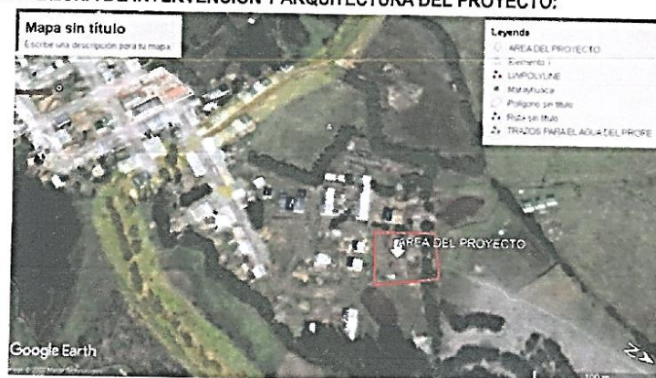
UBICACIÓN EN LA ZONA DE INTERVENCIÓN.

La Municipalidad Distrital de Incahuasi, cumpliendo con sus objetivos de brindar espacios adecuados para la práctica del deporte a la población infantil, juvenil y mayores, actividad que genera el desarrollo de una vida sana en la población del Distrito de Incahuasi, emprende todo un proceso de Gestión para lograr tal objetivo.