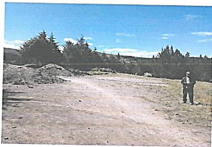
FOTO N° 01: Vista del CAMPO DEPORTIVO, ubicado en Caserío de MARAYHUACA donde se realizan práctica del deporte los pobladores del Caserío.