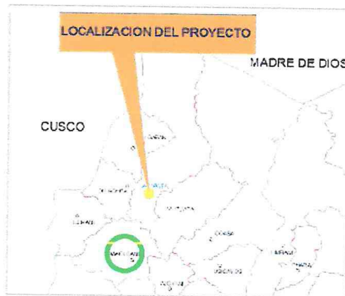
Fig. N° 03: Ubicación Distrital de la zona del Estudio