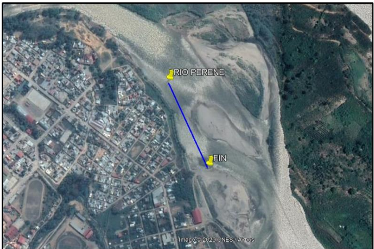
CROQUIS DEL TRAMO A INTERVENIR