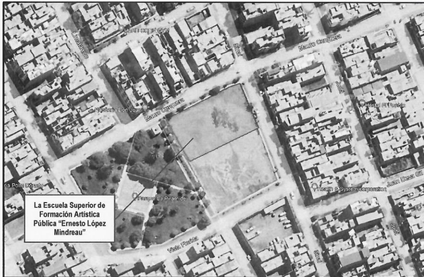
Imagen 02: Ubicación del Proyecto de la Escuela Superior de Formación Artística Pública "Ernesto López Mindreau", del Distrito de Chiclayo.