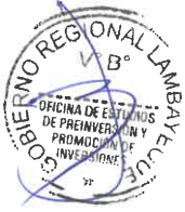
CUADRO N° 04