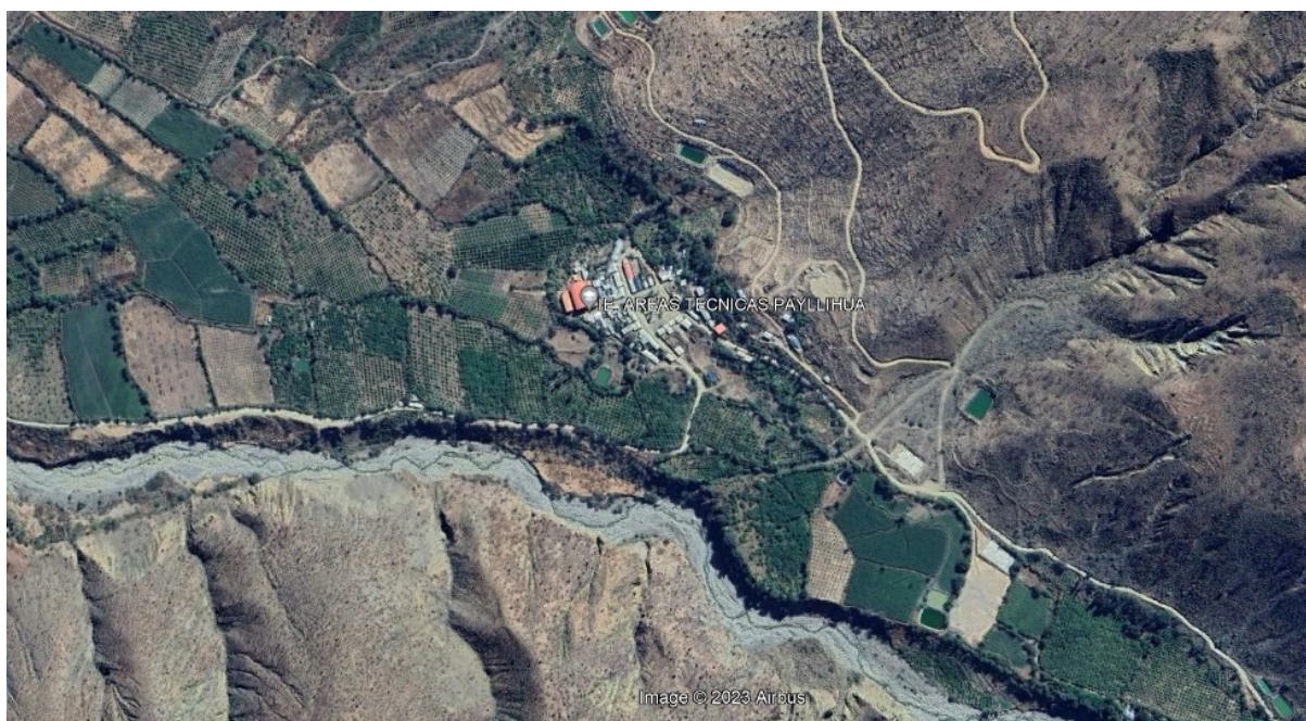
Localidad de Payllihua.

REGION : AYACUCHO DEPARTAMENTO : AYACUCHO PROVINCIA : LUCANAS DISTRITO : HUAC HUAS