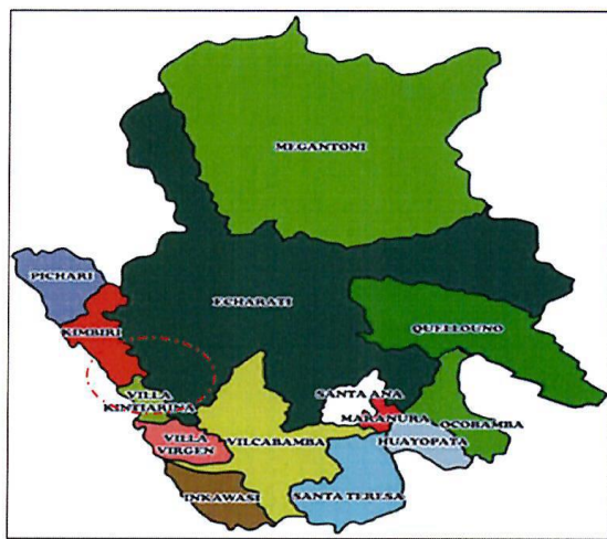
MAPA N° 3 UBICACIÓN DISTRITAL Y CENTROS POBLADOS