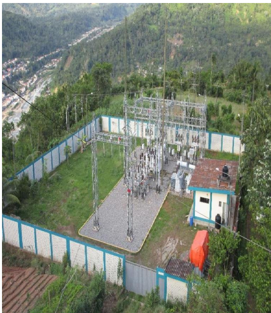
Subestación de San Francisco