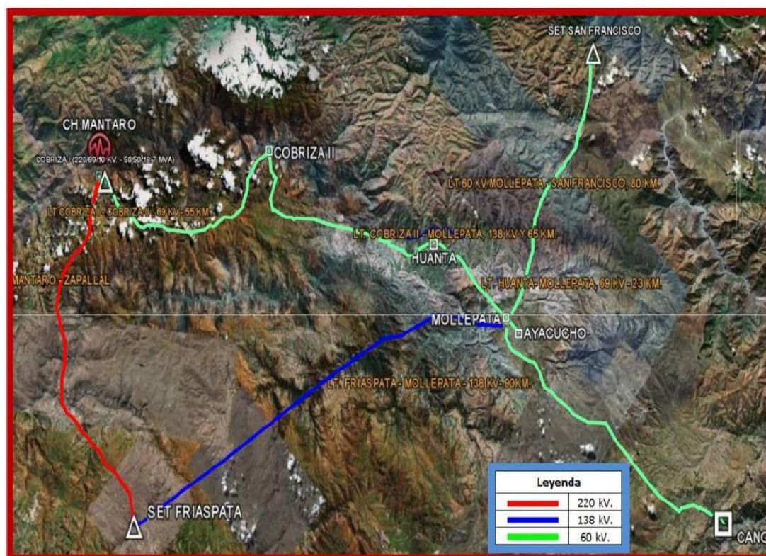
Fig. 1. Localización del área de influencia del Proyecto

La línea roja es la Línea de Subtransmisión 66 KV, donde se instalará la fibra óptica ADSS