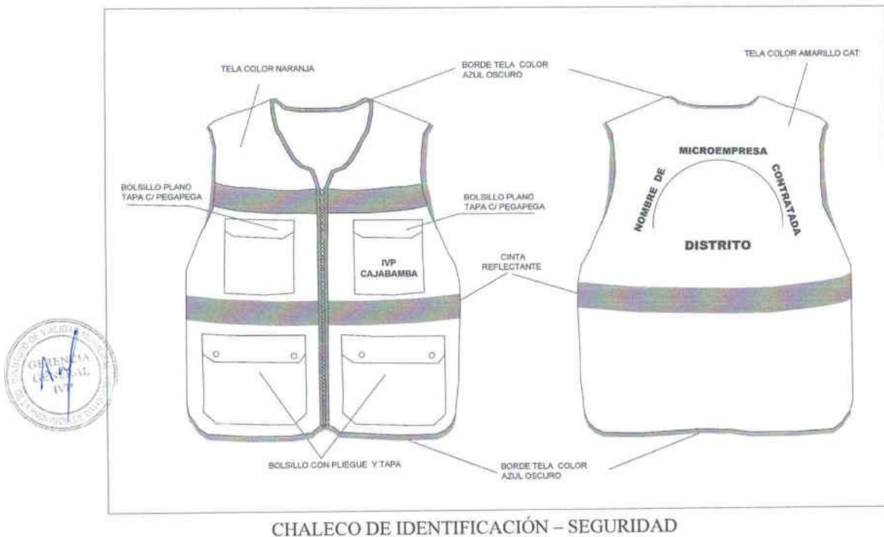
CHALECO DE IDENTIFICACIÓN - SEGURIDAD

INSTITUTO DE VIALIDAD MUNICIPAL DE LA PROVINCIA DE CAJABAMBA AÑO 2024