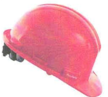
CASO DE SEGURIDAD