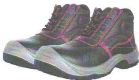
ZAPATOS DE SEGURIDAD TRABAJO – SEGURIDAD