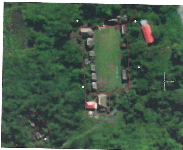
Imagen satelital de la ubicación del proyecto