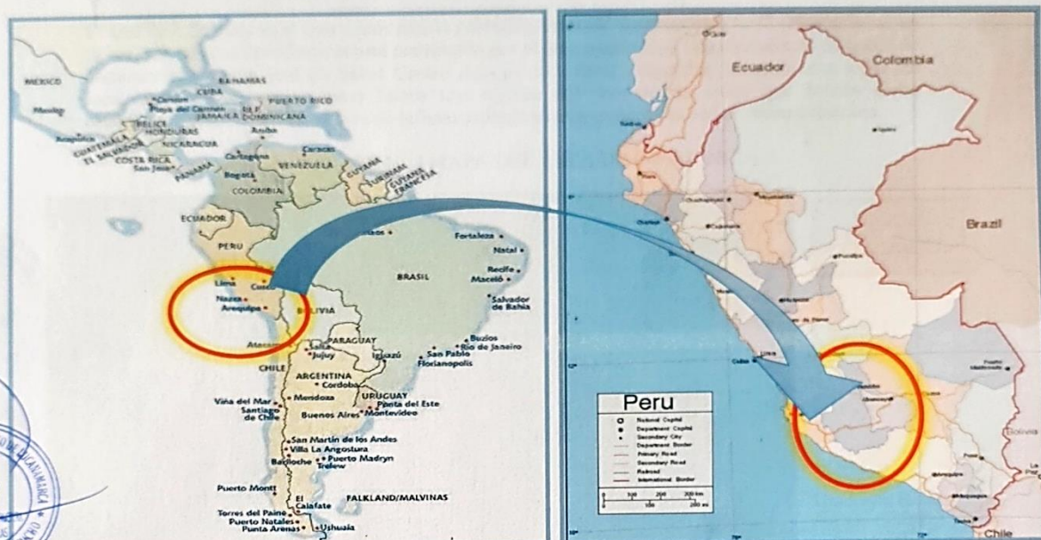
ILUSTRACIÓN N° 1 MAPA DE UBICACIÓN MACRO