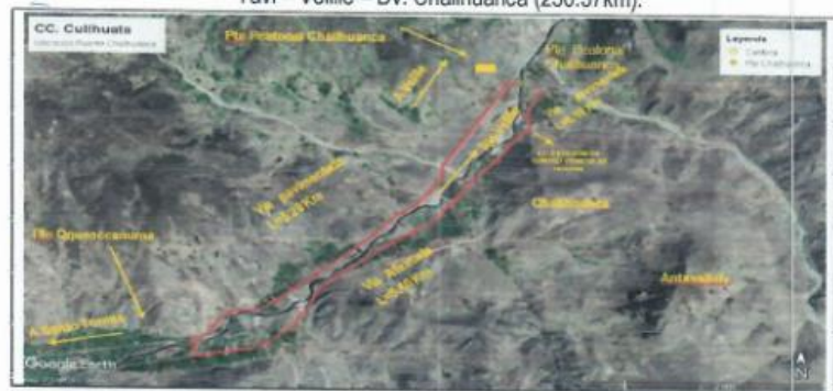
Imagen satelital de la obra, lugar de entrega del bien.