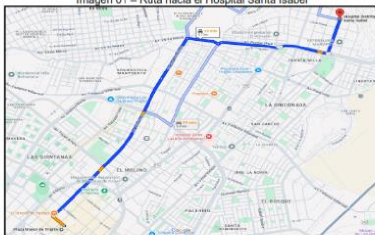
Imagen 01 – Ruta hacia el Hospital Santa Isabel

Desde el distrito de Trujillo se puede acceder por medio del transporte público y privado, las principales rutas de acceso cubren el recorrido siguiente: