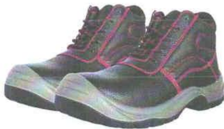
ZAPATOS DE SEGURIDAD TRABAJO – SEGURIDAD

INSTITUTO DE VIALIDAD MUNICIPAL DE LA PROVINCIA DE CAJABAMBA AÑO 2024