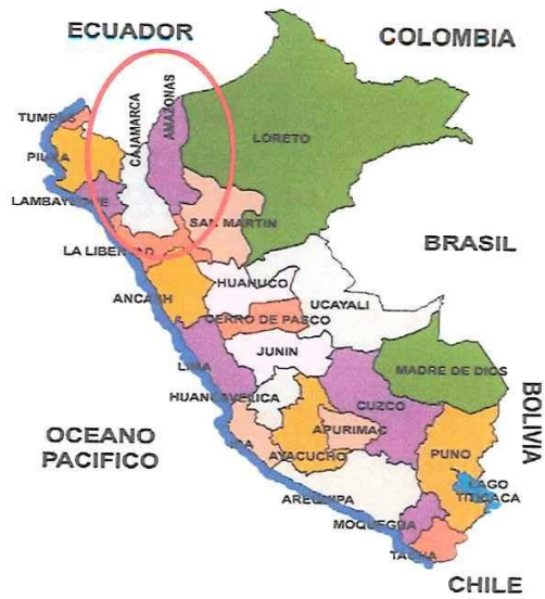
Ilustración 1: Mapa de Macro localización