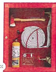
TIPO III / SISTEMA CONTRA INCENDIO DE EXTINCIÓN / GABINETE PARA MANGUERA / GABINETE CONTRAINCENDIO