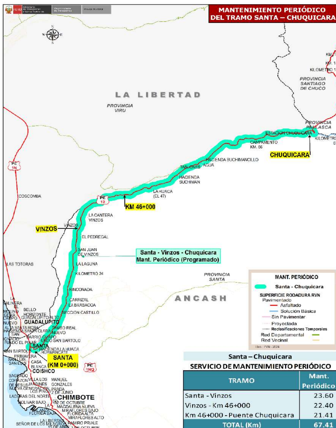
Figura: Mapa de Ubicación de la carretera: