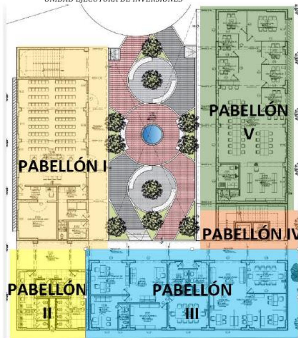
GRÁFICO: MASTER PLAN DE LA PROPUESTA