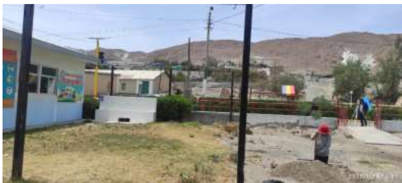
VISTA EXTERIOR DEL AULA PREFABRICADA EXISTENTE