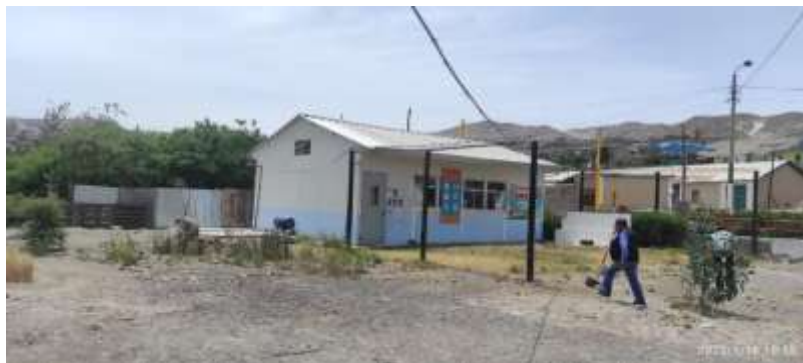
INTERIOR DEL AULA PREFABRICADA EXISTENTE