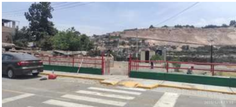
VISTA DEL INGRESO A LA IEI Y LAVATORIOS EXISTENTES