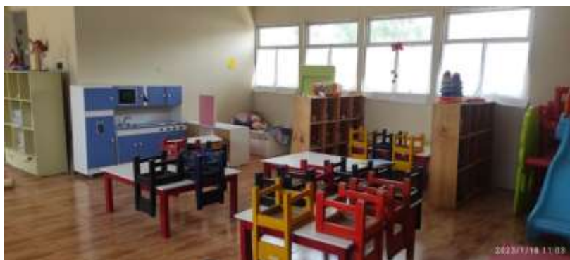
VISTA DEL CERCO PROVISIONAL DE PARIHUELAS DE MADERA