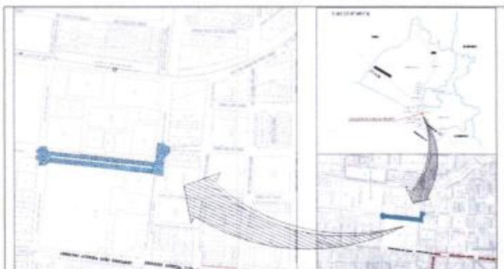
IMAGEN N° 02: Ubicación del área de intervención en la Av. Grau.