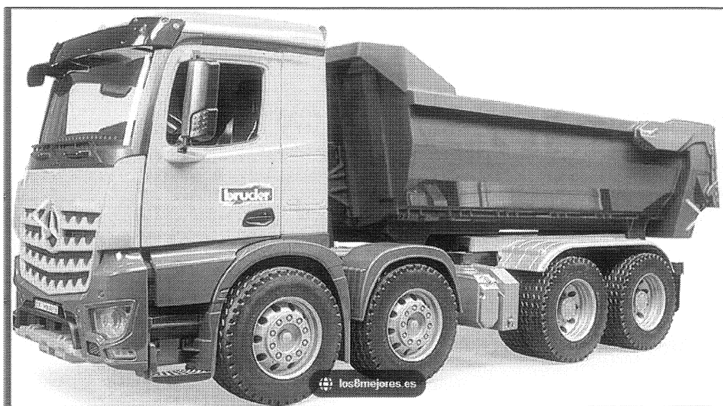
VOLQUETE (IMAGEN REFERENCIAL)