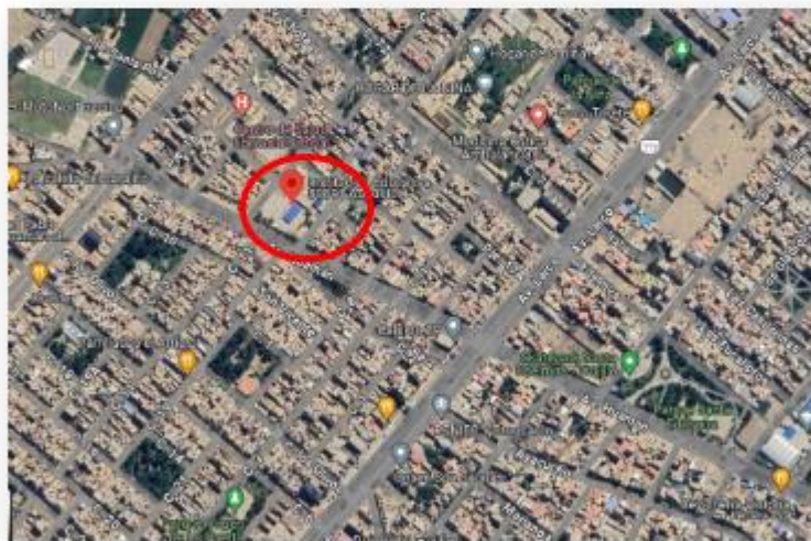
Ilustración 2- Ubicación del terreno - I.E.80891 AUGUSTO ALVA ASCURRA