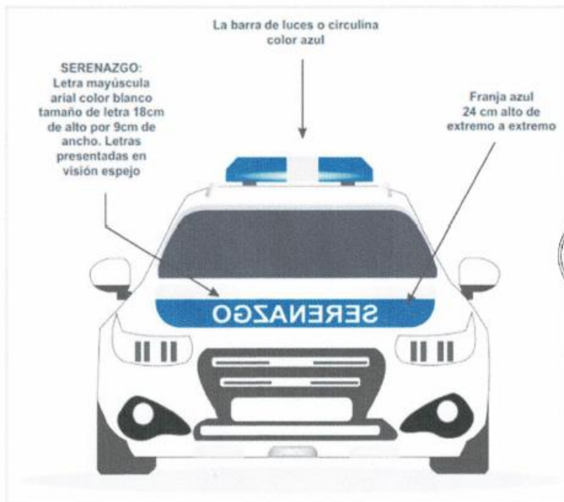
FIG.01 - FRONTAL