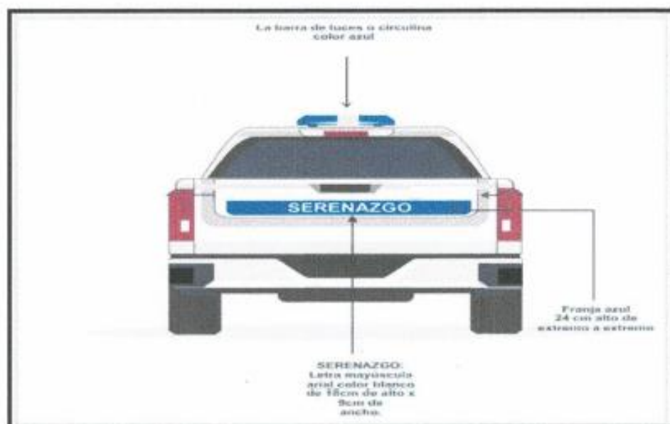
FIG.03 - POSTERIOR

Los gráficos N° 01, N° 02 y N° 03 son imágenes referenciales de la parte frontal, posterior y lateral del automóvil. En cada una de ellas se detalla la ubicación y características de los distintivos (escudo oficial de la municipalidad y la denominación de "SERENAZGO"), implementos (barra de luces o circulina de emergencia de color azul), las características de la letra empleada para el nombre de la municipalidad y la denominación de "SERENAZGO". Esta última denominación se encuentra sobre una franja de color azul (R2 G89 B196)