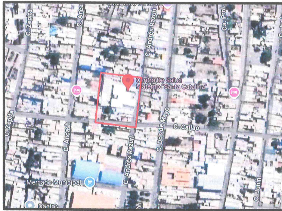
Imagen N° 1: Ubicación del Centro de Salud Materno Santa Catalina

La zona donde se ejecutará el mantenimiento se encuentra ubicado en el distrito de San Pedro de Lloc perteneciente a la provincia de Pacasmayo del departamento de La Libertad. El acceso a la zona del mantenimiento es desde la Calle Andrés Razuri N° 711.