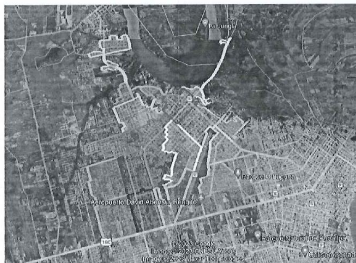
24 Zonas de recolección