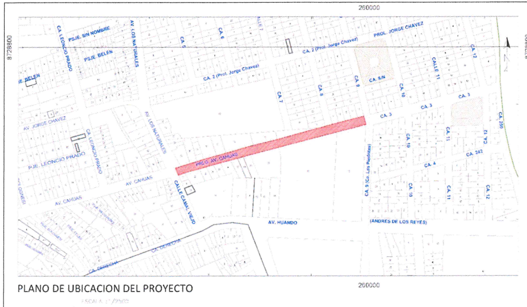
FIGURA 1. PLANO DE UBICACIÓN DEL AREA DE ESTUDIO PROLONGACIÓN CAHUAS.