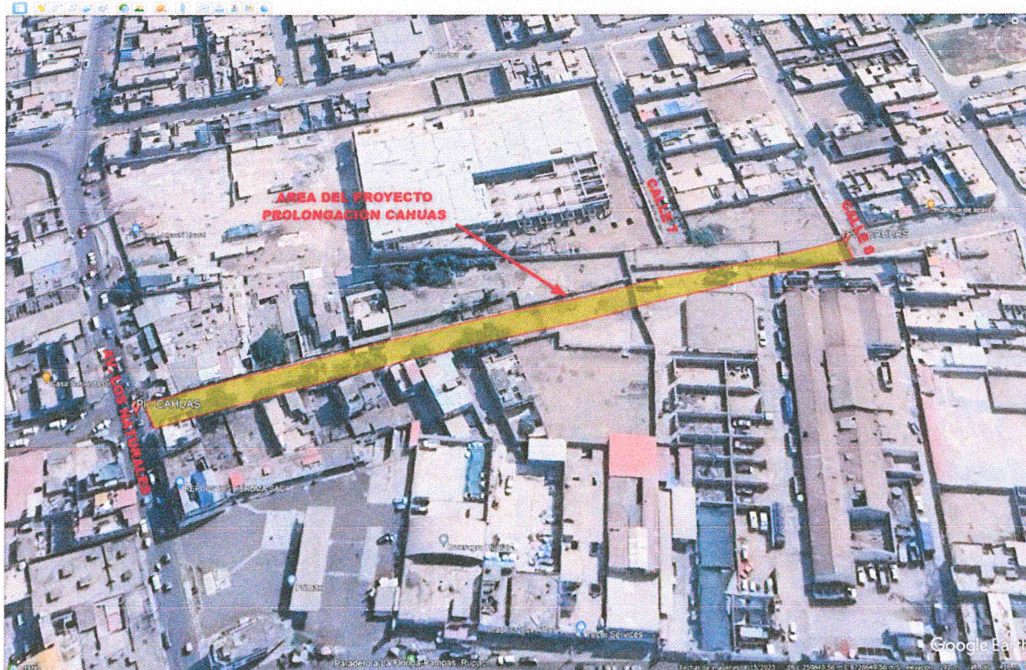
FIGURA 2. VISTA UBICACIÓN DEL AREA DE ESTUDIO PROLONGACIÓN CAHUAS.