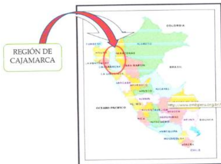
Ilustración 1: DESCRIPCION GRAFICA DE UBICACIÓN GEOGRAFICA.