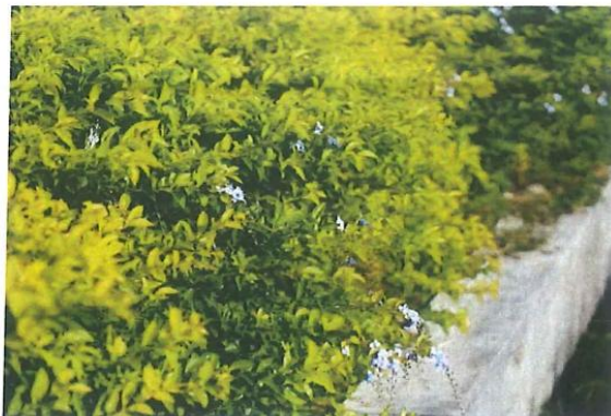
Imagen 6 Especie arbórea duranta limón

El paisajismo del proyecto contempla un total de 117 arbustos de la especie arbórea duranta limón, con el fin de embellecer y salvaguardar el área verde existente, en las intersecciones.