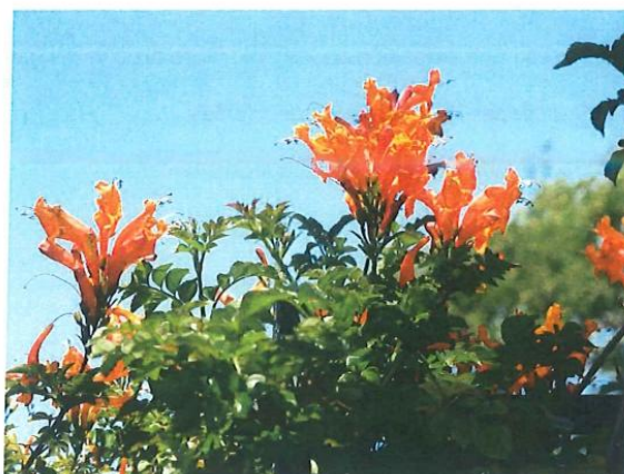
Imagen 7 Especie arbórea tecomaria

De igual forma en las islas canalizadoras se propone plantar un total de 329 plantas de tecomaria, entre naranjas y amarillas.