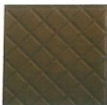
Imagen 1 Adoquín de Concreto tipo Larco (0.20x0.20x0.04m)

Se recomienda observar los planos de detalles constructivos y el plano general de arquitectura, para una mayor referencia.