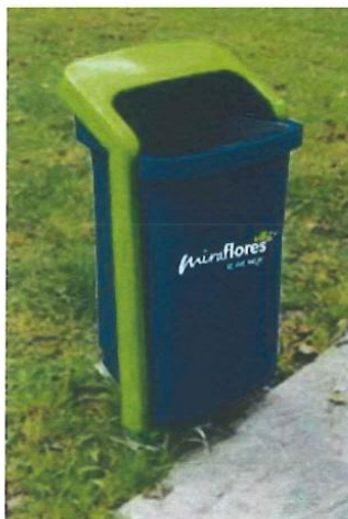
Imagen 4 Tacho de basura. (imagen referencial)

El depósito de basura será de polipropileno, de 50 Lt de capacidad, sostenido por un parante cuadrado metálico galvanizado, de color verde y azul. Además, tendrá el logo de la municipalidad de Miraflores en su frontis.