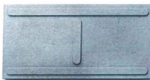
Imagen 3 Podo táctil de concreto color plomo tipo 1 línea / restaurante de (0.20x0.40x0.05m)