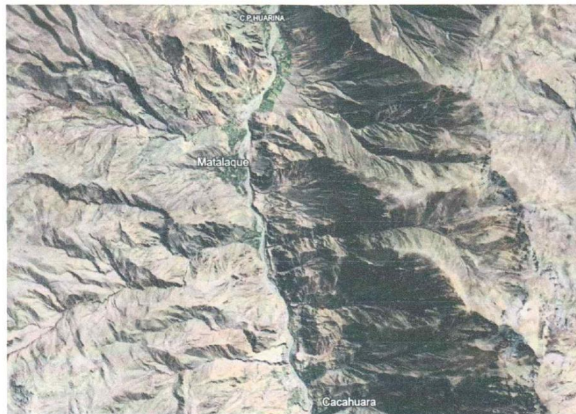
IMAGEN N° 2: IMAGEN SATELITAL DE UBICACIÓN DEL PROYECTO

GERENCIA DE INFRAESTRUCTURA Y DESARROLLO URBANO Y RURAL