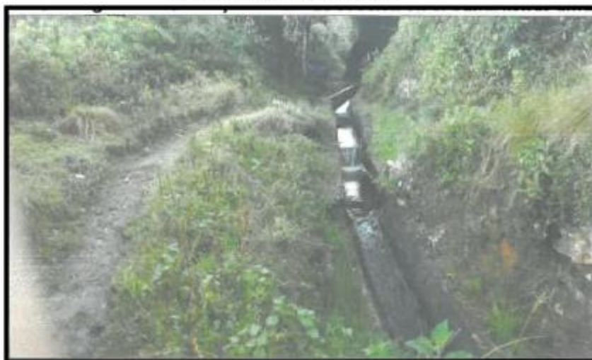
Imagen N° 02: Canal tierras amarillas