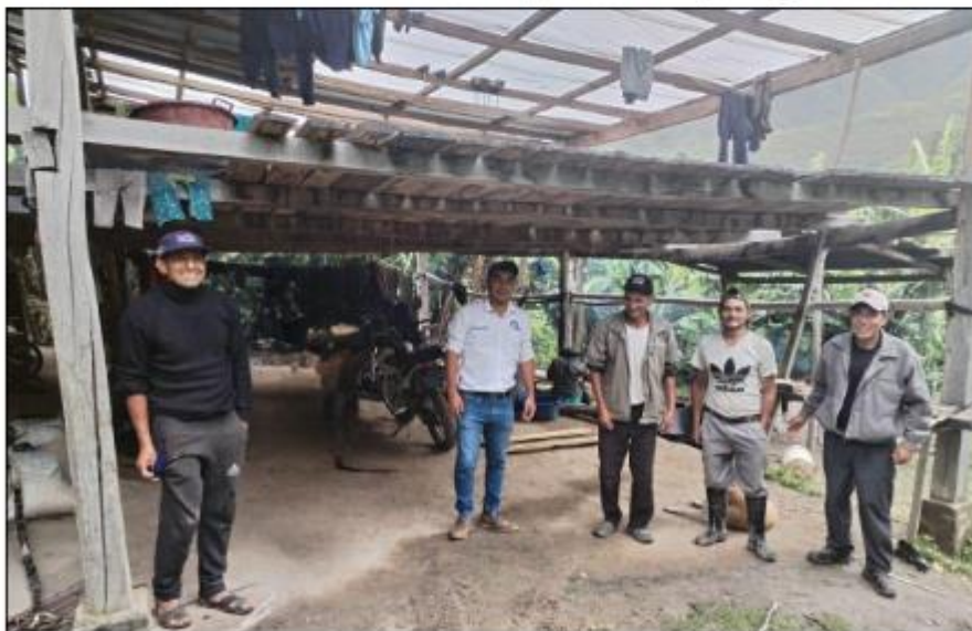
Coordinación con las Autoridades de Mancucur (Sondor) Marzo-2025

Son estructuras en mal estado presentan tramos erosionados, con peligro inminente de derrumbes, en el sector de Sondorillo la planificación de la campaña se realiza básicamente con riego por secano, por la falta de recurso hídrico siendo necesario obras de trasvase de subcuencas, para abastecer a la parte baja de Sondorillo.