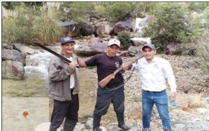
visita a la fuente de agua de la quebrada mancucur en coordinación con autoridades de mancucur (con carabina para ahuyentar el oso de la zona)- Marzo-2025

GOBIERNO REGIONAL DE PIURA GERENCIA SUB REGIONAL DE MORROPON HUANCABAMBA