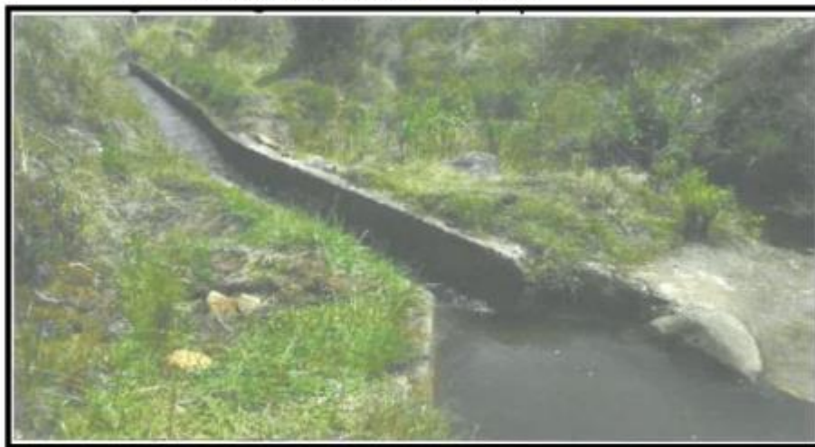
Imagen N° 03: Canal Cascapampa - Captación

El Canal Cascapampa cuenta con secciones irregulares tramos de canal en tierra erosionados y tramos de canal revestidos con mampostería de piedra y concreto, la estructura de captación ubicada cerca al centro turístico de peroles, está formada por una estructura de concreto rectangular con dos compuertas y un vertedero de demasías, canal con pendientes pronunciadas y variables en todo el recorrido, secciones rectangulares, obras de arte como rápidas y acueductos en varios tramos en su recorrido.