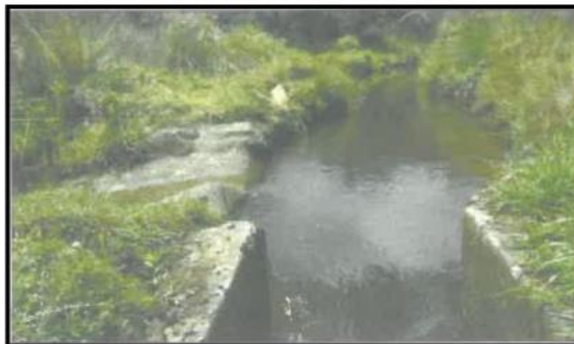
Imagen N° 04: Canal Cascapampa – tramos erosionados