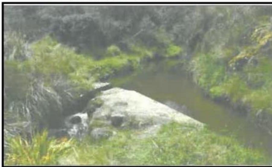
Imagen N° 05: Canal Cascapampa – Captaciones en mal estado

GOBIERNO REGIONAL DE PIURA GERENCIA SUB REGIONAL DE MORROPON HUANCABAMBA