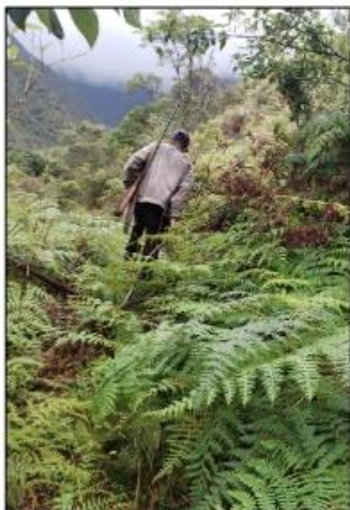
Zona Boscosa, en el recorrido hacia la captación principal-Marzo 2025

Durante el trayecto se constató la presencia de abundante vegetación que complica el acceso. Asimismo, los moradores señalaron que la zona se mantiene húmeda debido a constantes lloviznas y que en el área habita fauna silvestre, lo que puede representar un riesgo para quienes ingresan. Por tal motivo, se recomienda realizar futuras visitas en compañía de un guía local y portar herramientas de defensa adecuadas.