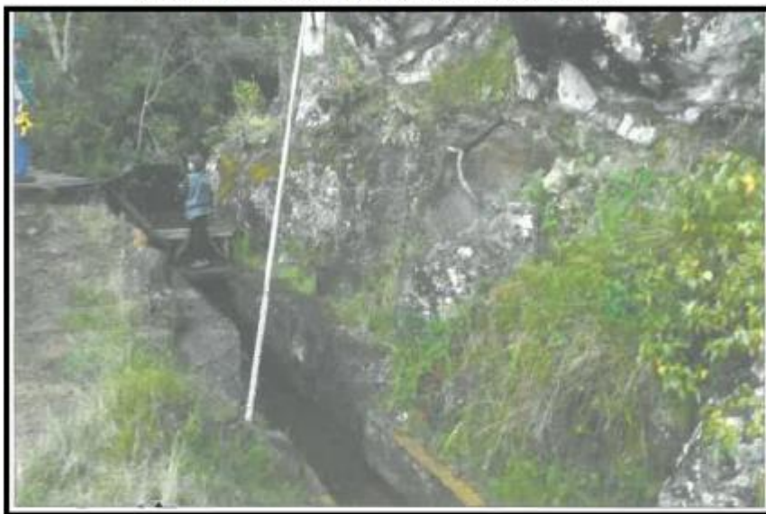
Imagen N° 01: fotografía de la captación canal tierras amarillas

GOBIERNO REGIONAL DE PIURA GERENCIA SUB REGIONAL DE MORROPON HUANCABAMBA